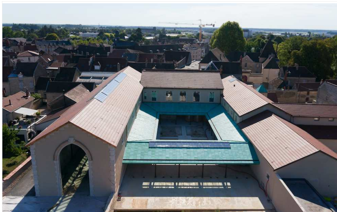
Vue pendant les travaux de la cour recouverte d'une galerie et qui était auparavant fermée par un mur (au premier plan). A gauche, la cuverie ; la vendange sera triée dehors, sur le parvis.

Partout, dans les 5.000 m2 rénovés, les propriétaires n'ont pas lésiné sur la qualité des matériaux : pierres de Comblanchien pour les encadrements des fenêtres et des portes, pierres calcaires pour les parements des façades, sols en porphyre, ou en parquets de chêne pour la salle de dégustation et les deux suites réservés aux clients, à l'étage.