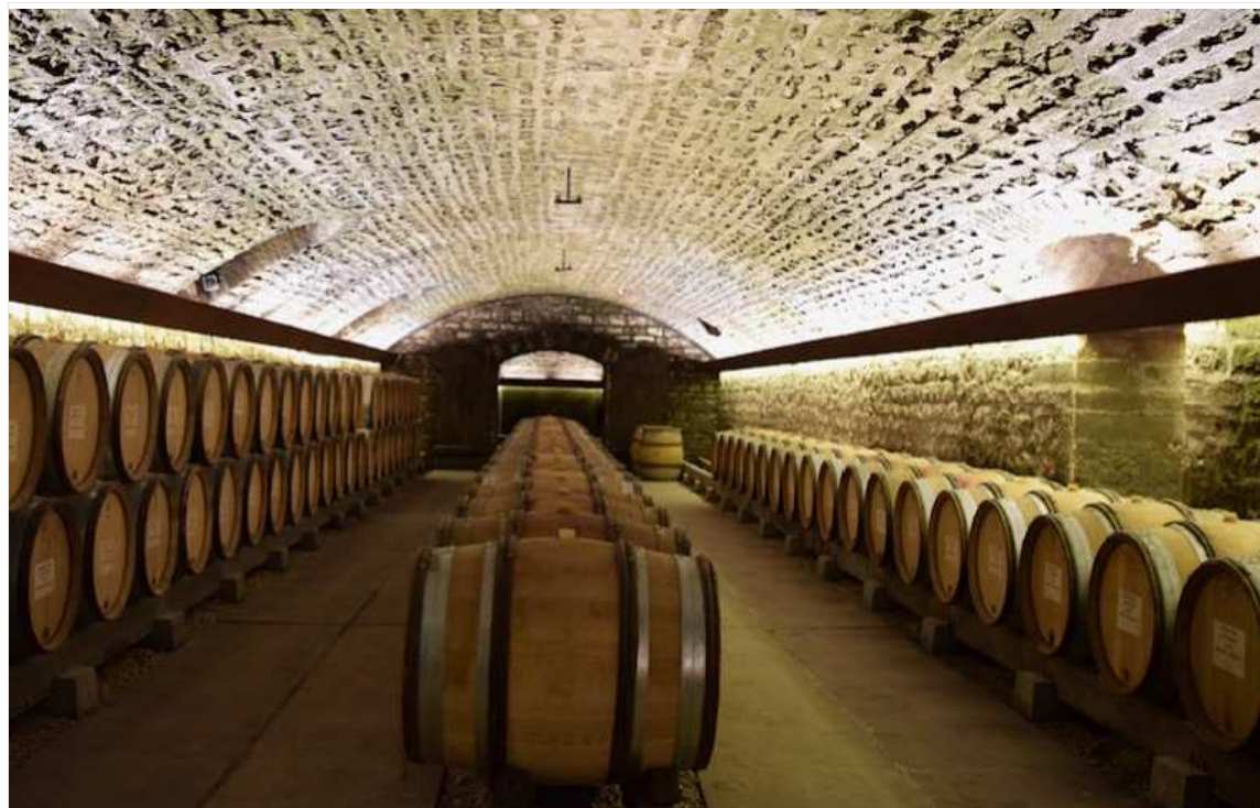
L'éclairage des caves a été refait pour mettre en valeur leurs voûtes.

Ce projet clôt une série d'investissements dépassant les 15 millions d'€ engagée il y a deux ans et qui a donné le jour à une nouvelle cuverie à Mercurey (Saône-et-Loire) et à un autre site de vinification et de stockage en périphérie de Nuits-Saint-Georges.